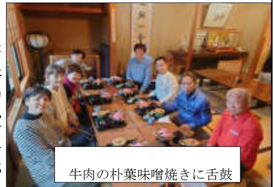
牛肉の朴葉味噌焼きに舌鼓

「日本母親大会のステージで大アピール」と書かれた写真なども。午後、郡上八幡城に着くころには、雨足も強くなっていましたが、多くの観光客が訪れていました。ちょうど、火縄銃の実演があり、雨のため、テントの下で鎧を身に着けた鉄砲隊が、順に弾をこめて撃ちました。最後は、それぞれお土産をたっぷり買い込んで帰宅の途につきました。「雨でも楽しめるよう、企画されていて良かった」「楽しかった」と感想が聞かれました。車の運転をした方、準備をした方、皆さんご苦労様でした。