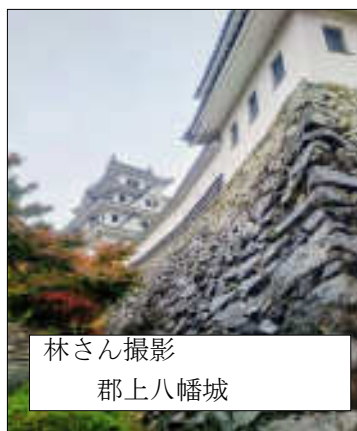
郡上八幡城

山田支部は、11月9日(日)8人で岐阜県郡上八幡へ。あいにくの雨でしたが、郡上八幡楽藝館や郡上八幡城を見学し、昼食は、新橋亭で牛肉の朴葉味噌焼きを堪能。1904年に建てられた楽藝館は、もともとは病院で、平成の最初の頃まで開業していたとのことで、レントゲン施設や診察室が残り、診察台や手術道具が展示されていました。また、2000年に公開された映画「郡上一揆」のパネルや資料が展示され、なかには